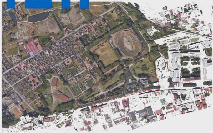
The Ancient City of Pompeii Pompei Scavi