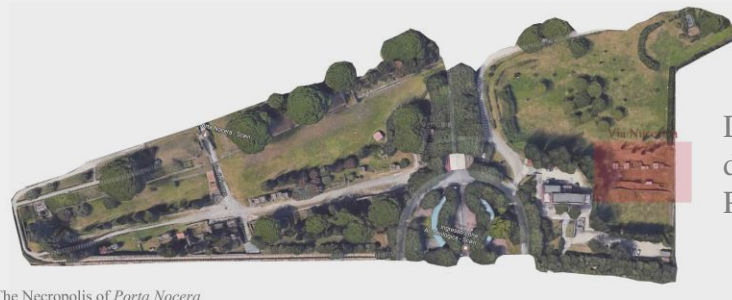
The Necropolis of Porta Nocera La Necropoli di Porta Nocera