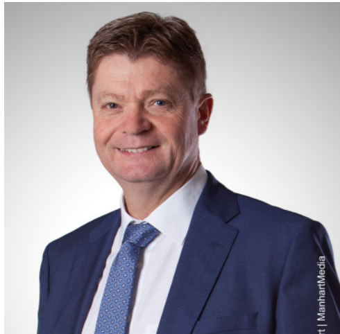
Harald Stadler Erster Bürgermeister