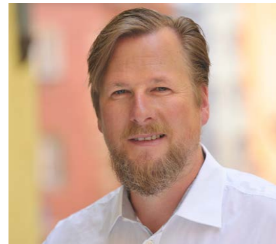
Thomas Kästle Projektmanagement Leben findet Innenstadt/Lebendige Zentren